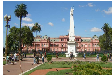
Uno de estos días en Plaza de Mayo

★ Le proponemos que realice una lectura interpretativa de las imágenes que se presentan, seleccione dos de ellas y complete el siguiente organizador: