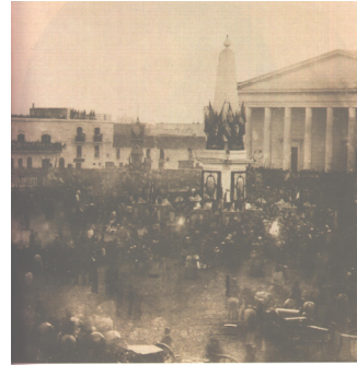
Jura de la Constitución - 1854