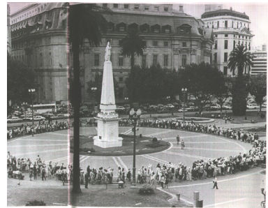
Las madres de Plaza de Mayo - 1981