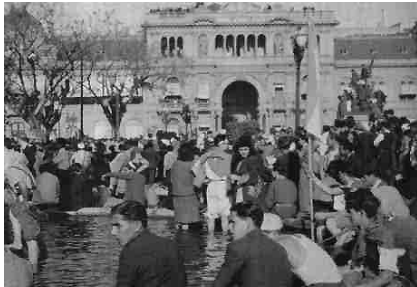
La plaza de mayo el 17 de octubre de 1945