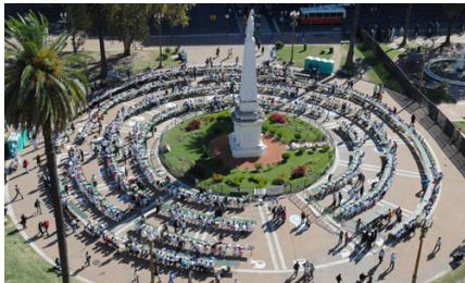
600 alumnos participan de la Jornada de Ajedrez; 2009