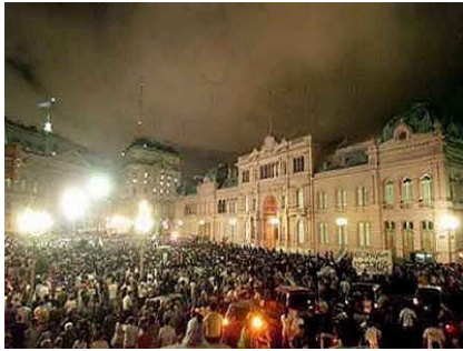
El cacerolazo; diciembre de 2001