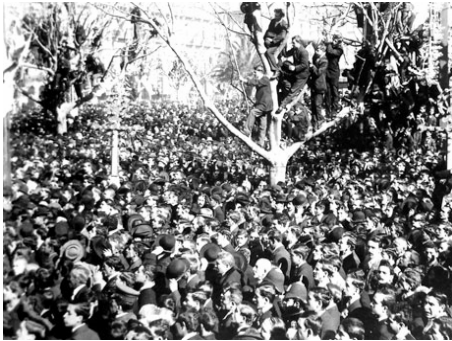
La plaza de Mayo en el festejo del Centenario