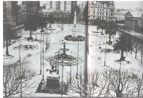
Nevó en Plaza de Mayo - 1918