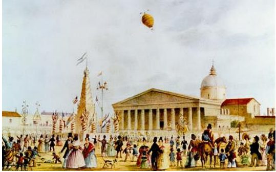
Fiestas Mayas (Pellegrini, C. 1841)